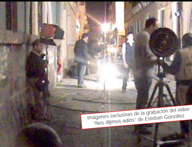
Imágenes exclusivas de la grabación del video "Nos dijimos adiós" de Esteban González