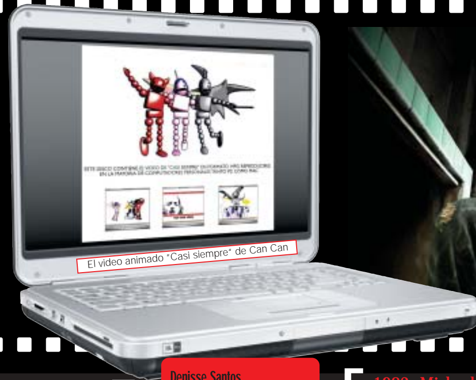
El video animado "Casi siempre" de Can Can