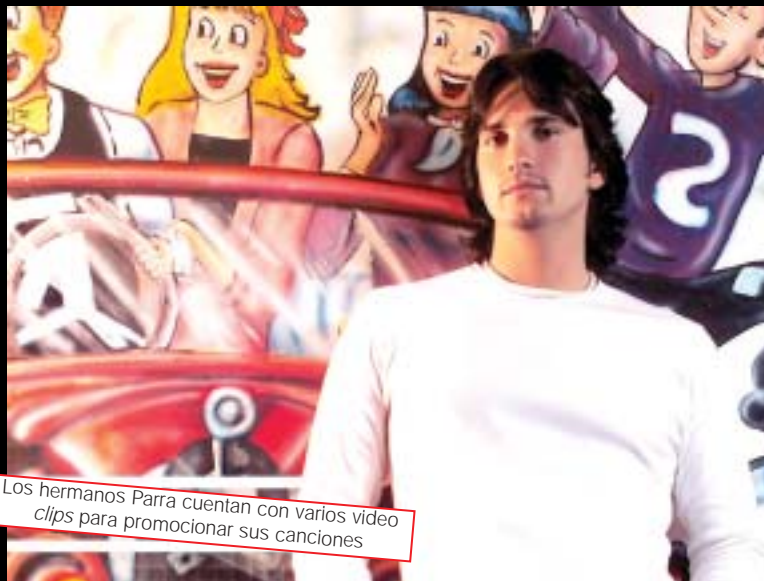
Los hermanos Parra cuentan con varios video clips para promocionar sus canciones